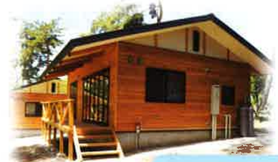
芸術むらコテージ