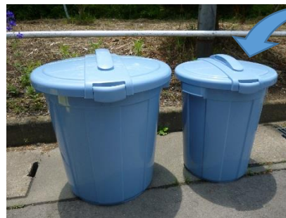
大型ポリバケツ (蓋付き)