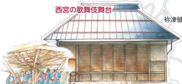
西宮の歌舞伎舞台