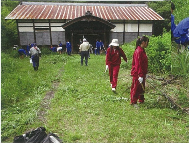
見違えるようにきれいになった境内

手つきで背丈ほどに伸びた草と格闘する事 一時間弱、見違えるように境内はきれいにな りました。