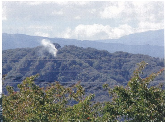
外山城 (八重原)の狼煙