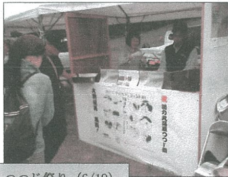
つつじ祭り (6/19) での煎餅焼き

俳画も含め生涯一万点といわれる作品の一部が定期的に入れ替わり展示され、観客の皆さんを魅了しております。