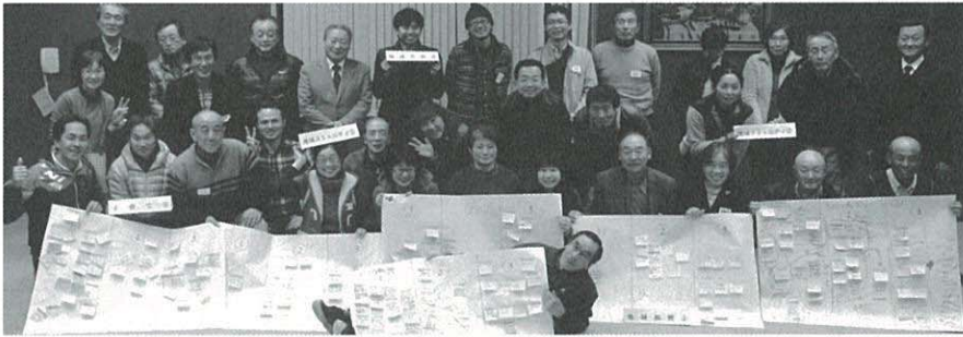
1月30日(土)のワールドカフェに集まった面々 最前列の人気者はだれだ?