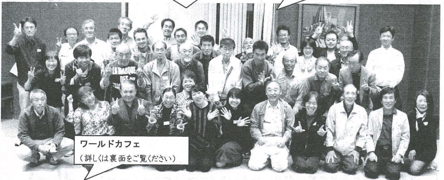
ワールドカフェ (詳しくは裏面をご覧ください)