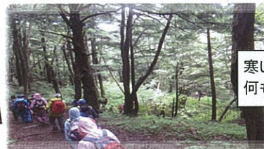
寒いです 何も見えない