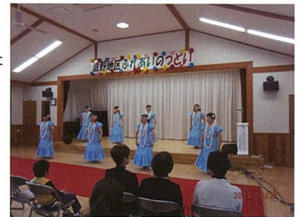
フラダンスの皆さん