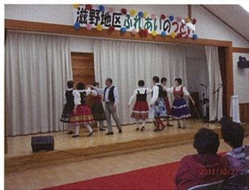
フォークダンス教室