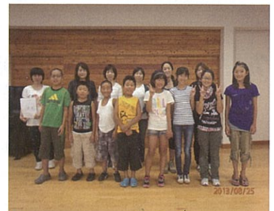
通学合宿参加児童4班・保護者