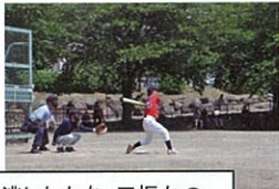
見逃したかな・三振か？

ゲートボール 1位 赤岩 B 2位 別府 3位 赤岩 A (室内ゲートボール場)