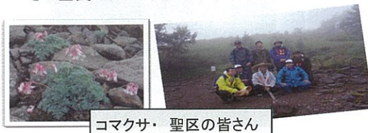
コマクサ・聖区の皆さん