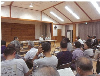
総会を開催:通学合宿の経過説明と協力をお願いする