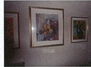
見ていただきましょう