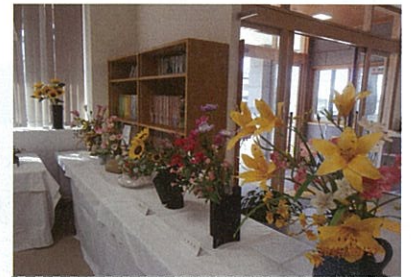
でんぶんと樹脂粘土作品生花の様

恒例の滋野地区ふれあいのつどいが 開催されました、大勢の参加で盛大に開催されました 片羽公民館では、風船を使って作品を作る リサイクル材でおもちゃ作り等行いました *豚汁コーナー*200食 瞬間に終わりました