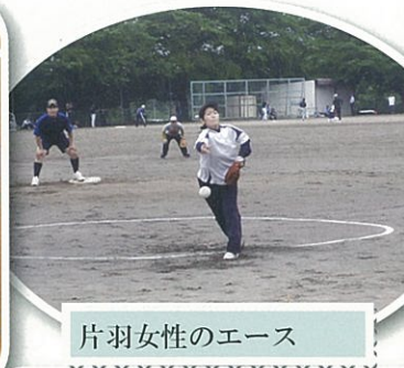
片羽女性のエース