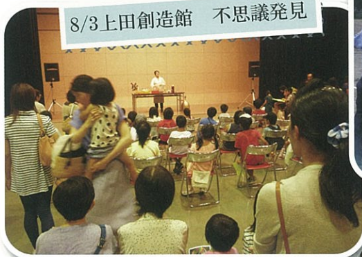
8/3上田創造館 不思議発見