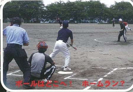
ボールはどこへ！ ホームラン？