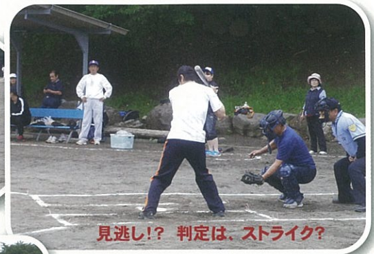
見逃し!? 判定は、ストライク?