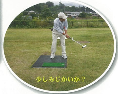
少しみじかいかな？