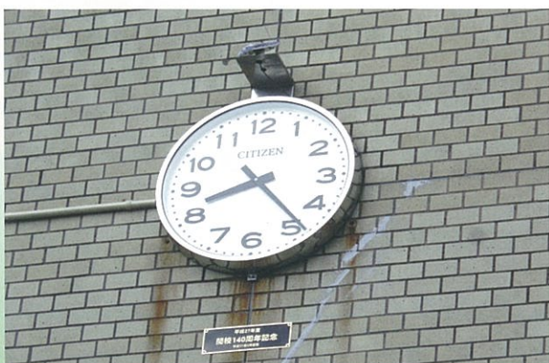
【外時計 (H26.2.13 設置)】