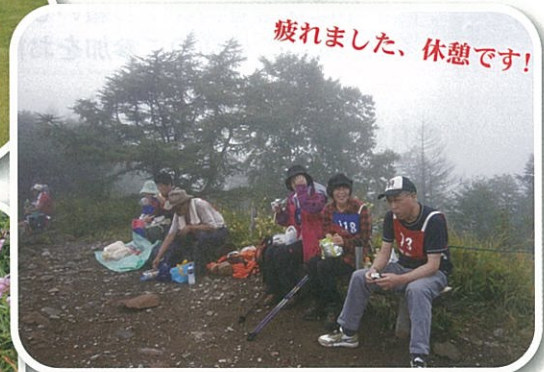
疲れました、休憩です！