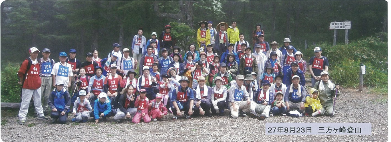
27年8月23日 三ヶ峰登山