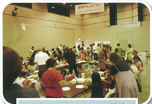
不思議発見ツアー 皿回しに挑戦