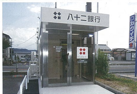
牧家 ドラックストア駐車場に 八十二銀行 ATM が設置されました

会からのお知らせ！ 地域ビジョン作成にあたり ワークショップを計画しております。 日程 平成27年10月12日（祭日） 時間 午後2時～5時頃迄 場所 滋野コミュニティセンター 多目的 滋野地区の方であれば参加自由 ご希望の方は会迄ご連絡下さい。 TEL 62-0401 秋山