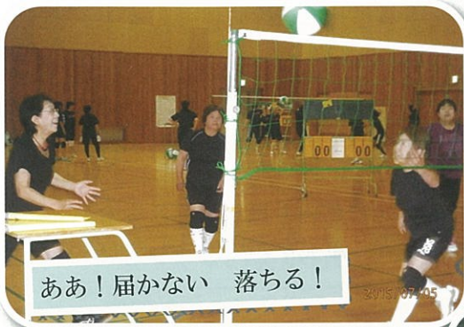
ああ！届かない 落ちる！