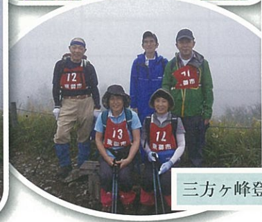
三方ヶ峰登山 各地区の皆さん