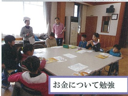
お金について勉強