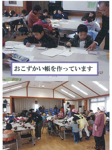
おこずかい帳を作っています