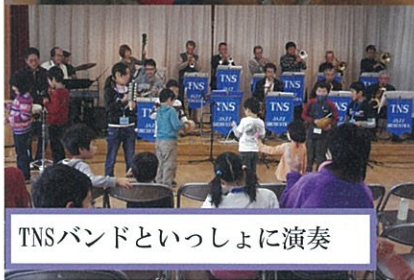
TNSバンドといっしょに演奏