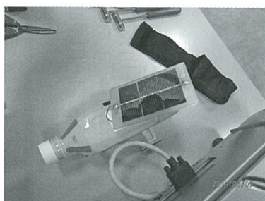
ソーラーカー作成