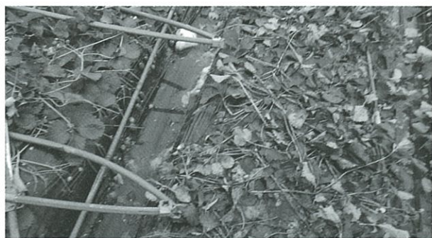
イチゴハウス解体・無残なイチゴ畑