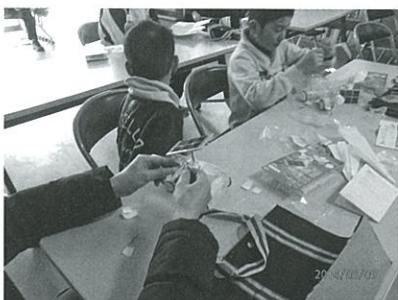
ソーラーカー作成中