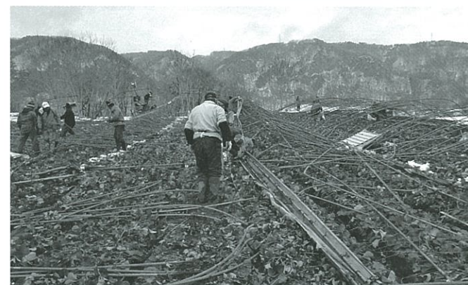
無残なイチゴ畑・解体中のパイプ