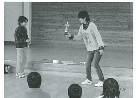
兄弟でけん玉妙技披露

* お手玉遊び、12月にお手玉を作りました、今度はお手玉で遊びました。みんな楽しそう紙飛行機も作りました。