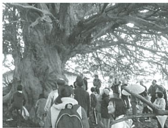
カヤの巨木 樹齢700年

明けましておめでとうございます。 「しげの里づくりの会」がスタート して8ヶ月が過ぎました。