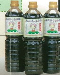
しょう油 カラメル色素の入っていない昔ながらの 製法で1年半熟成したしょう油