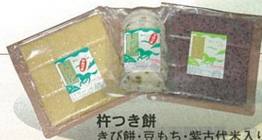
杵つき餅 きび餅・豆もち・紫古代米入り餅