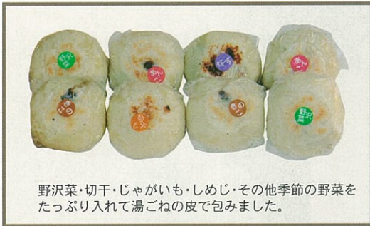
野沢菜・切干・じゃがいも・しめじ・その他季節の野菜をたっぷり入れて湯ごねの皮で包みました。