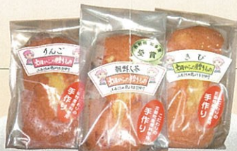
パウンドケーキ 高麗人参・きび粉・りんご・あんこ入り 手作りパウンドケーキ