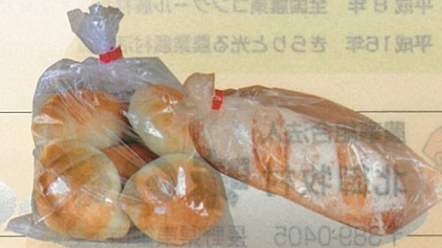
パン 地粉にこだわったコクのある 味わいのあるパン