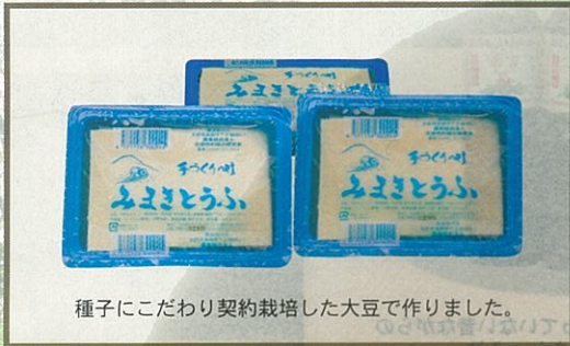
種子にこだわり契約栽培した大豆で作りました。