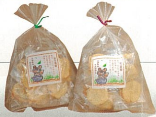
クッキー きび粉、モロヘイヤ粉が入り、甘さひかえめのクッキー