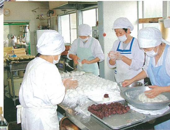
芸術村のシンボル「結の高欄」