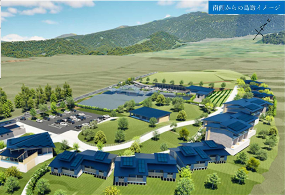
南側からの鳥瞰イメージ