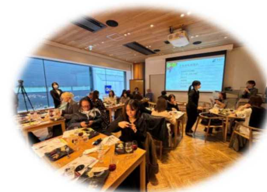
▲昨年度実施した食を中心としたPRイベントの様子(場所:銀座NAGANO)

※ビッグデータ:「多種多様かつ巨大なデータ群」です。 例えば、スマートフォンの位置情報など観光客の移動や滞在の傾向などを把握分析することで、観光施策に役立てることができます。