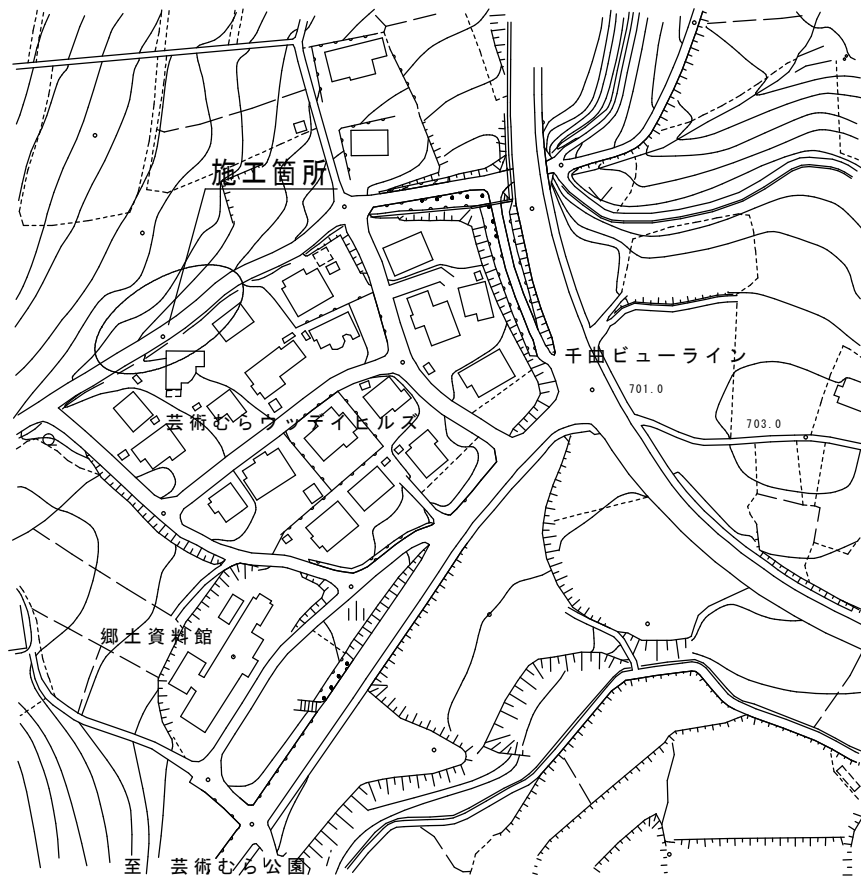
位置図 S=1 : 2500