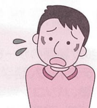
(消費者庁イラスト集より)