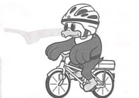
長野県警察シンボルマスコット「ライポくん」