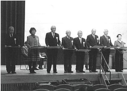
▲地域福祉功労表彰者