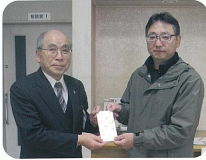
▲株式会社ヴィラデストワイナリー様