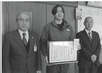
▲東御市立北御牧中学校