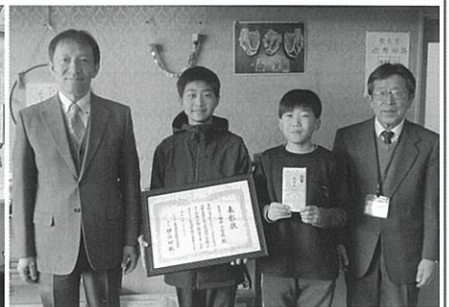
▲東御市立田中小学校