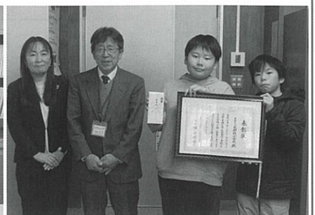
▲東御市立北御牧小学校