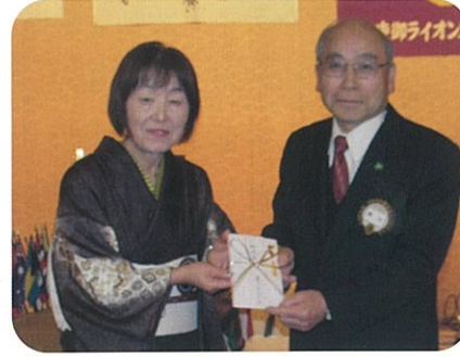
▲東御ライオンズクラブ様