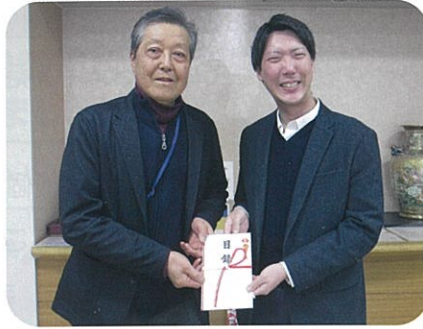
▲東御キリスト教会様