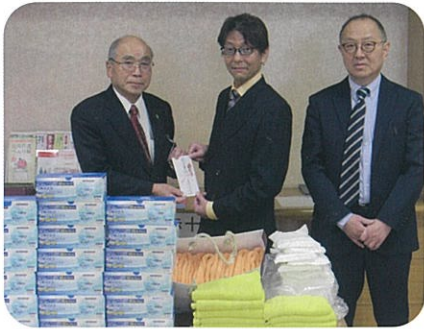
▲理容組合東部部様