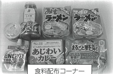
食料配布コーナー