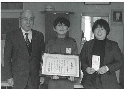
▲東御市立祢津小学校児童会