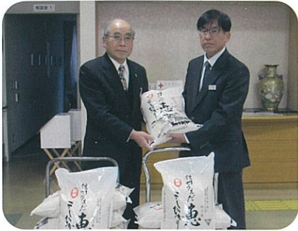
▲JA信州うえだ東部地区事業部様