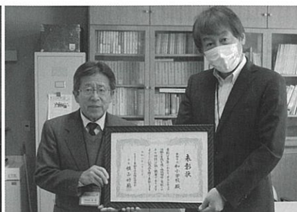
▲東御市立和小学校