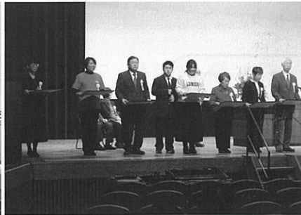
▲ボランティア功労表彰者