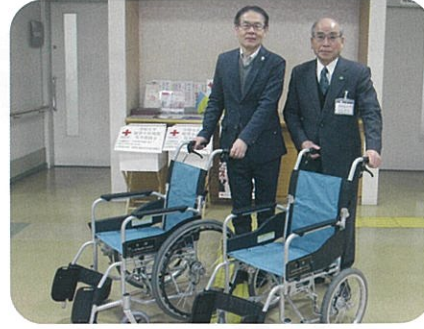
▲宍雷電くるみの里様