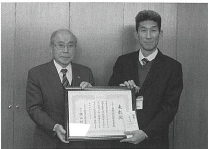
▲東御市立東部中学校福祉委員会