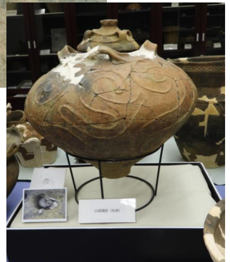
東御市文書館・文化財展示室に展示中

残念ながら、詳細な記録は無くこの写真のみで、発掘調査の「記録保存」には充分とは言えませんが、この写真からだけでも大変貴重な土器であると言えます。一部に赤い採色された部分と黒い漆のような部分が残っています。