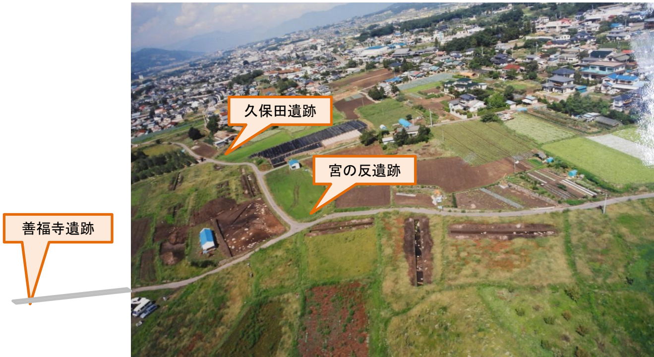
久保田・宮の反・善福寺遺跡全景

団体営ほ場整備事業瀬下地区の実施に先だつ発掘調査が行われました。善福寺跡の部分は、残念ながら工事中に見つかっており、詳細は不明です。工事で発見された3つの壺には、いっぱい焼骨が詰まっていた。