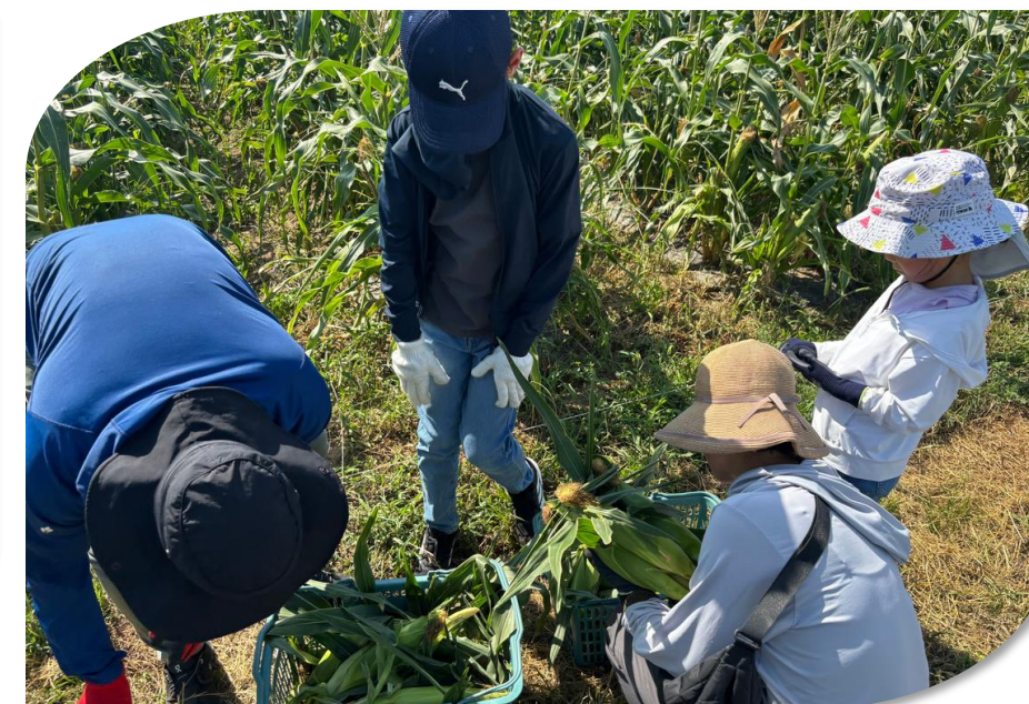
農作業体験と古民家宿泊(2025.10)