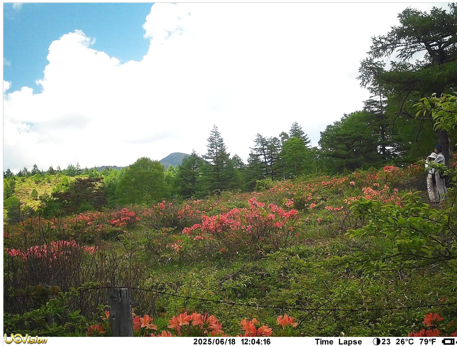
実際のライブカメラの映像