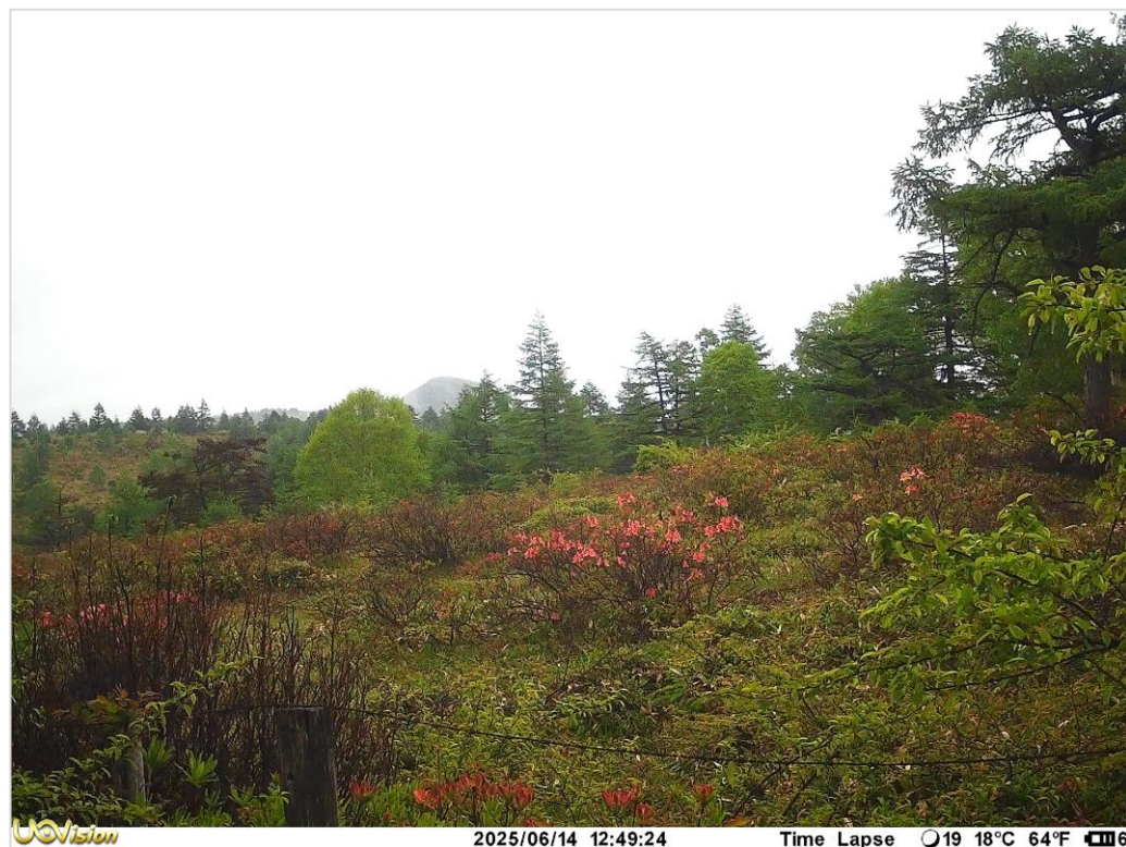
判断が難しい時期