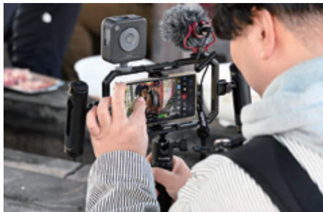
▲講師の指導を受けながら撮影技術を磨きました

塾生それぞれの視点で切り取られた、魅力あふれる東御市の映像を、ぜひこの機会にお楽しみください。