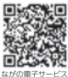
ながの電子サービス