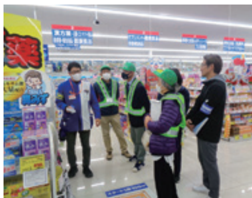
▲青少年補導委員によるチェック活動の様子

昨年 11 月には、青少年市民会議役員（青少年補導委員、市子ども会育成連絡協議会役員、市内小中学校・東御清翔高校 PTA 役員）が市内の店舗を巡回しました。訪問した店舗からは、酒類販売の際に年齢確認ができなかったのが販売しなかった、風邪薬等の販売では医薬品等決められた用量を守らずに過剰摂取（オーバードーズ）とならないよう販売数量には気をつけている、との話がありました。