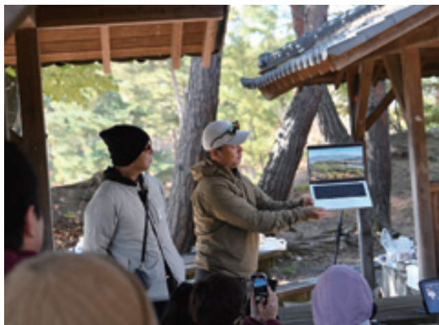
▲芸術むら公園キャンプ場でのドローン撮影講義の様子