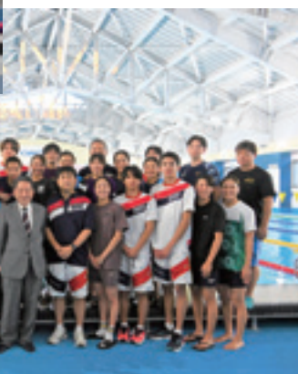
▶合宿を行った日本水泳連盟の選手団

12月10日、GMO アスリーツパーク湯の丸の屋内プールにおいて、「競泳インターナショナル強化選手合宿」および「OWS(オープンウォータースイミング) ナショナルチーム合宿」の公開練習見学会を開催しました。