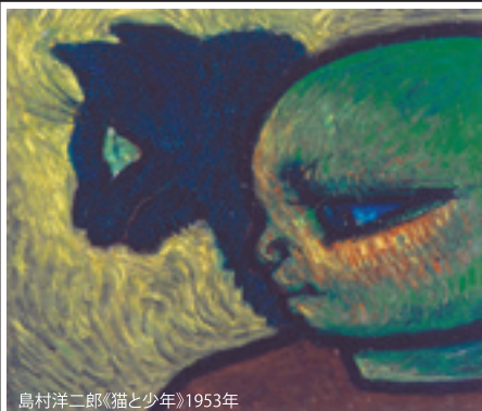
丸山洋二郎「猫と少年」1953年

丸山晚霞記念館 ■TEL 62-3700 ■〒389-0515 東御市常田505-1 文化会館内 ■開館時間 9:00～17:00 ■入館料200円 (高校生以上) ■月曜休館 (祝日の場合翌火曜)