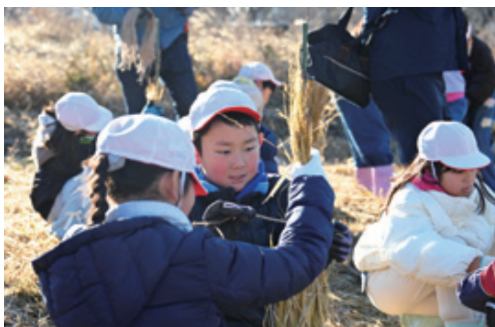
▲一本一本丁寧に藁を巻く祢津小学校の児童

12月18日、ワインテラス御堂の南斜面において、ワインブドウの苗木の凍害を防ぐための藁巻き作業を行いました。4月に、ワインブドウに親しめる体験圃場づくりの一環として、祢津小学校の児童とともにブドウの苗木を植え付けました。今回は、その苗木を冬の寒さから守るため、同校の児童と一緒に藁巻き作業を実施しました。参加した児童たちは、作業の意味やブドウ栽培の大切さについて説明を受けながら、一本一本丁寧に藁を巻き、ワインづくりを支える畑の仕事を体験しました。