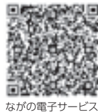
ながの電子サービス

初めての一人暮らしを控えている方 必見!今日からすぐ作れるレシピを 伝授します。