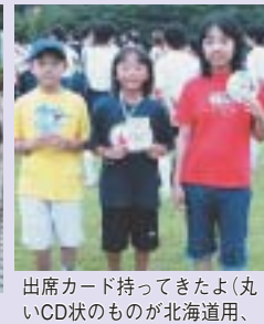
出席カード持ってきたよ(丸いCD状のものが北海道用、遠くからありがとう)