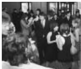
久しぶり〜！ホールに声が響きわたる