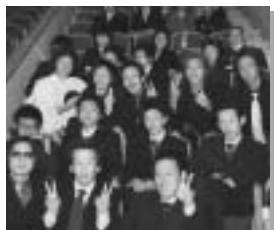
みんな変わったかな？