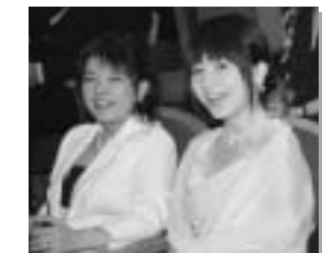
久しぶりの再会、話はずんだ