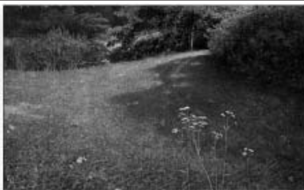
梅野記念館 1989 個人展 (Tsunehiko Inuzuka)

感慨のため息をつく人たち、作品をじっと見つめて涙する人、何かを考えしばらく動かない人、両手を食い入るように見る子ども達— 2009年、日本中を感動させた犬塚勉。そして2012年、全国を巡る一大道作品展。本展はその長野展として開催いたします。