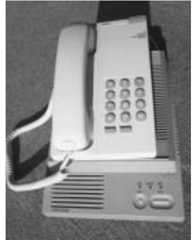
回収予定の有線電話器とNTU (有線放送機械)