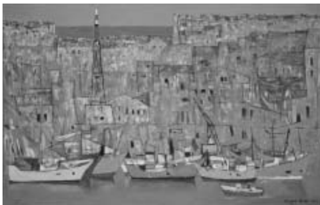
小さなタワーのある港(群馬県立近代美術館蔵)