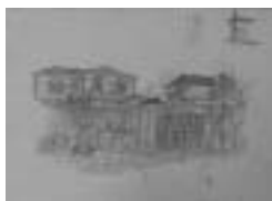
映画「樋口一葉」のためのデッサン