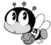
生涯学習キャラクター 「まなびー」

④万が一に備えての保険加入や活動で生じたトラブル等については、依頼を受けた団体等とご協議をいただくこととなります。