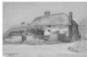
丸山晚霞 高田新一(1)村の朝景

表現さまざま 水彩はここまで描ける! みんなが習った水彩画、みんなの知らない水彩力