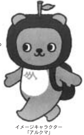
イメージキャラクター「アルクマ」