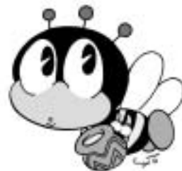
生涯学習キャラクター「まなびー」