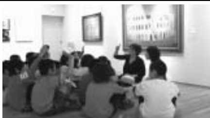
対話型鑑賞とはこのようなイメージです。