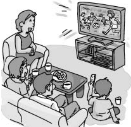
ケーブルテレビ専用デジタルチューナー

東部地区のケーブルテレビ加入者の皆さんは㈱上田ケーブルビジョン（電話23-1600）までお問い合わせください。