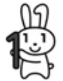
マイナンバー キャラクター マイナちゃん