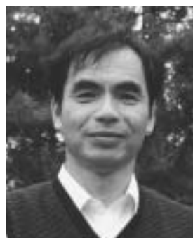
【講師プロフィール】

哲学者 立教大学大学院 21世紀社会デザイン研究科教授 NPO法人「森づくりフォーラム」代表理事 1950年、東京都世田谷区生まれ 1970年頃から、東京と群馬県の山村、 上野村との二重生活をしている