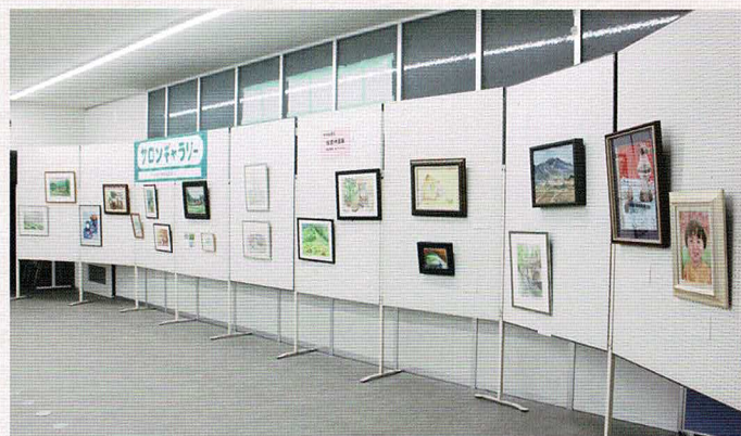
6/17～8/15 御牧絵画会 絵画作品展