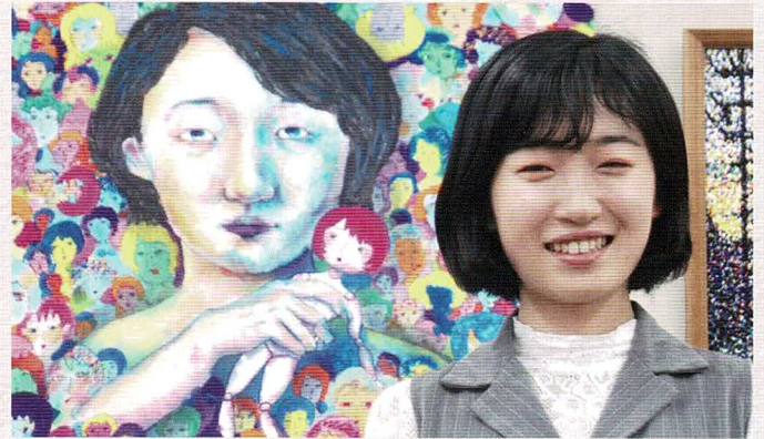
「それでは反省会を始めます」の前に

これらの顔はどんな思いなのだろうか。表情には数多くの感情表現が込められています。230人の感情豊かな明日美さんの表情を見てゆくうち、自分を知ることは