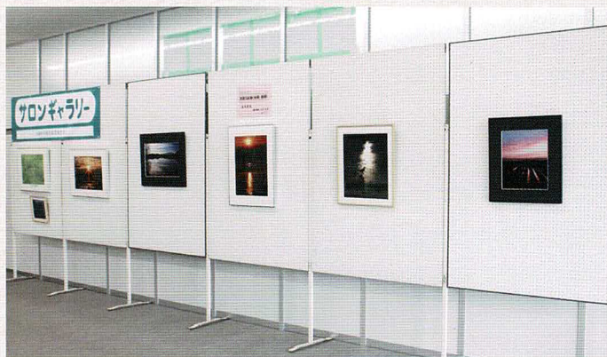
5/25～6/16 初夏の大地（水鏡、新緑）滝澤英雄