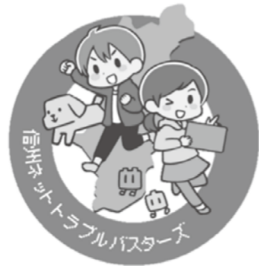
(信州ネットトラブルバスターズ)

これは、小中学生に一人一台のタブレット端末を整備する「GIGA スクール構想」により、タブレットを自宅に持ち帰ることで、ネット利用のハードルが下がっていることを踏まえて、被害に遭った時に抱え込まず、身近な人や窓口相談してもらうために行っているもので、多くの児童生徒に利用していただくよう官民で協力して周知に取り組んでいます。