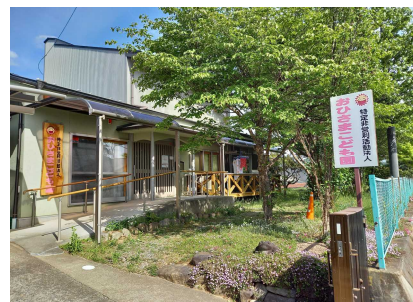
第3おひさまこども園