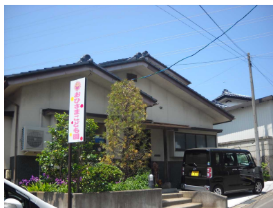
第2おひさまこども園