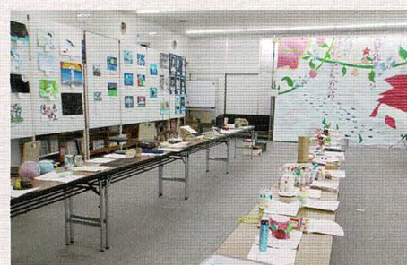
北御牧小学校・中学校生徒の作品展