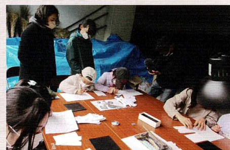
鍍金ワークショップ