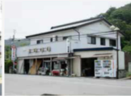
富士屋商店（島川原） 電話 67-2028