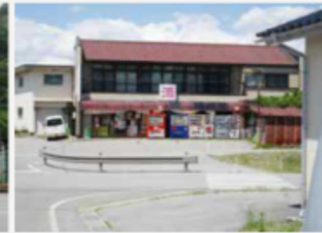
柳田利商店（南部） 電話 67-2225