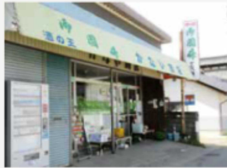
金井商店（上八重原） 電話 67-2757

北御牧地区には、上八重原に金井商店（電話 67-2757）、島川原に富士屋商店（電話 67-2028）、南部に柳田利商店（電話 67-2225）があります。どちらのお店も配達相談に応じています。飲食店では大抵のお店がテイクアウトを行っています。いろいろな企業が移動スーパーの事業を行っています。そんな中この地区を回っている移動スーパー「ぜん」（電話 090-8106-3086）と偶然会うことができました。お店を元気に、みんなで元気に、この北御牧を盛り上げて行きましょう。