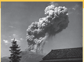
昭和33(1958)年12月14日の噴火による噴煙の様子

噴火した場合、火口から4km以内では、50cm程度までの大きな噴石(岩塊)が飛んでくる可能性があります。明治時代以降の噴火で犠牲になった方々は、全て火口から4km以内にいた登山者で、噴石(岩塊)の直撃を受けて亡くなっています。