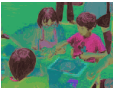
陶芸教室のようす

これだけ多くの工程と、多くの人の協力がなければ出来ない登り窯焼成のスケールの大きさに私は感銘を受けました。