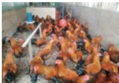
とや原ファームの信州黄金シャモ

信州生まれのブランド地鶏は、田中駅周辺の一部の飲食店や通販で購入できますので、ぜひ食べてみてくださいね。