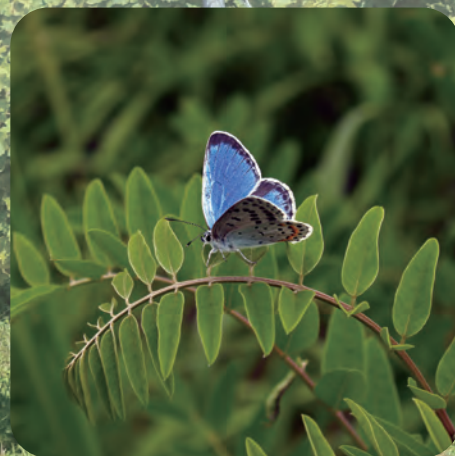
市の蝶 オオルリシジミ