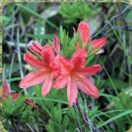
市の花 レンゲツツジ