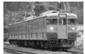
信越線130周年記念リバイバル 115系リレー号 115系（イメージ）

☎／（一社）信州とうみ観光協会 ☎62-7701 Eメール info@tomikan.jp HP http://tomikan.jp （商工観光課 観光係）