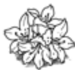
市の花 レンゲツツジ