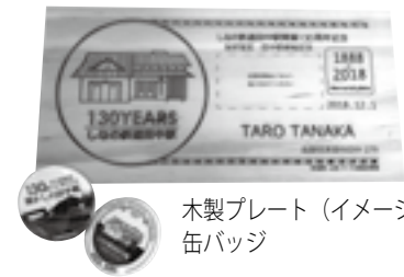
木製プレート（イメージ） 缶バッジ