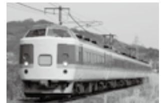
信越線開業130周年記念号 189系（イメージ）