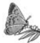
市の蝶 オオルリシジミ