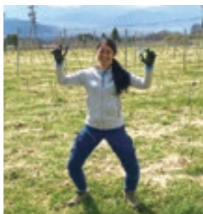
ヴィンヤードで剪定中♪

昨年度は千曲川ワインアカデミー3期生として、毎週東御市に通っていました。ワイン、狩猟、エコツーリズム、カメラ、ブッシュクラフト、登山、水泳、音楽etc.やりたいことや勉強したいことがいっぱい！いろいろな方と交流して、東御市の観光を盛り上げていきたいです！