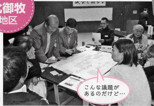
こんな議題があるのだけど…

「議会と語る会」のトップを切って開催された北御牧地区。はじめてのワークショップ形式に議員も緊張済み。