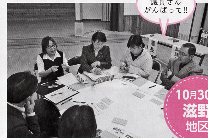
もっと議員さんががんばって!!

田中地区は中央公民館にて開催。土曜日開催という事で、開催時間を子育て世代の方にも参加しやすい昼間の設定（午後2時～）としました。