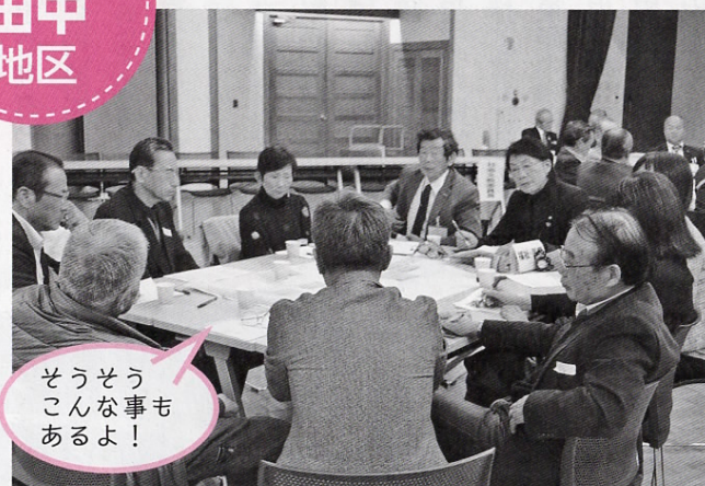
そうそうこんな事もあるよ！

田中地区は中央公民館にて開催。土曜日開催という事で、開催時間を子育て世代の方にも参加しやすい昼間の設定（午後2時～）としました。