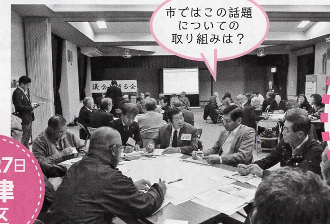
市ではこの話題についての取り組みは？

今回の語る会の中で、最も多くの皆さんにご参加いただいた柵津地区。人数が多いので急遽グループ分けを多くし開催！時間が足りないほど活発なご意見をいただきました。