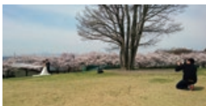
満開の桜と残雪の山並み。東御中央公園(写真)と芸術むら公園には感動しっぱなし