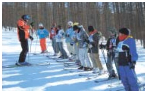
▲好天に恵まれ楽しかったスキー教室

うちには植物がたくさんあります。なぜかというところ、お母さんが好きだからです。でも、一年前、私がお母さんにあげた植物は今、元気がありません。「きつと、愛がたりないんだ。」と思いました。だから、だきしめました。そうしたら、元気になったような感じがしました。もっと、家族みんなのいる近くに置いて見守っていききたいです。