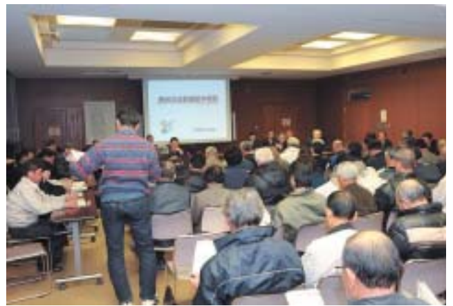
▲意見や要望も寄せられました

このような説明会は初の開催となり、市が平成22年度に行う主要な事業を取り上げ、新年度が始まる前にあらかじめ市民の皆さんの理解と要望を聞くことを目的に行われました。今回説明がされたのは、市役所庁舎を増改築(図書館合築)する「舞台が丘整備基本計画」と今年10月開局を目指す「コミュニティFM放送」についての2事業で、参加した皆さんは熱心に耳を傾けていました。