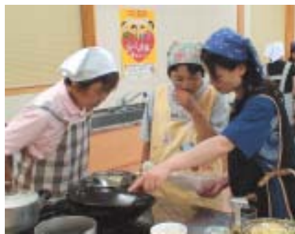
▲調理実習であらためて食事を見直す

「元氣はつらつ・自分磨き」をテーマに、補導員自らが自分を磨いて健康的な生活習慣を身に付けようと活動してきました。今年度は、毎日必ずとる「食」に焦点をおいて、市で