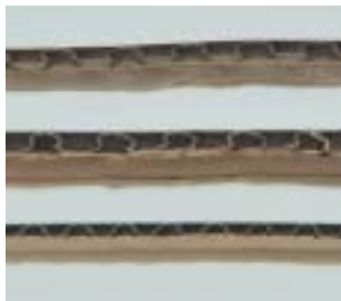
断面が波状のものがダンボールです

ダンボールは10枚ぐらいで束ねてください。貼られているガムテープや伝票はできるだけ取り除いてください。