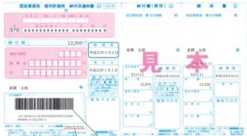
— コンビニ収納バーコード — コンビニで納付できる期限〔コンビニ取扱期限〕