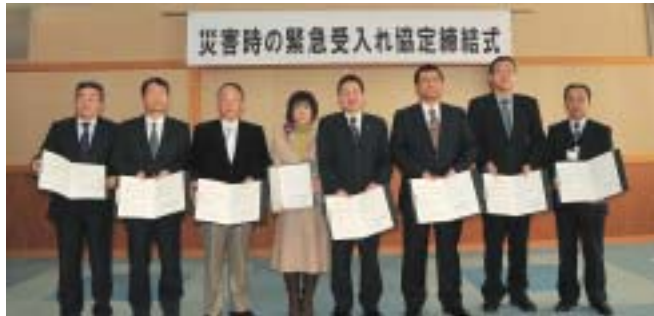
▲花岡市長と法人関係者で記念撮影