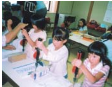
▲制作活動を熱心にとりくむ児童

児童館ではこのような自由遊びのほかに、月に1回程度行事を開催します。1年生を迎える会やお楽しみ会、ドッジボール大会、ホッケー大会などの集会や運動、数珠玉ブレスレットや洗濯バサミ鉄砲などの制作活動、ボランティアの皆さんによるお話しのお会やお手玉教室がその内容です。子ども達はこれらの行事をととても楽しみ