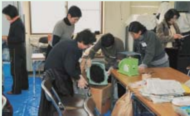
▲腐葉土などの重さを測り、箱の中へ