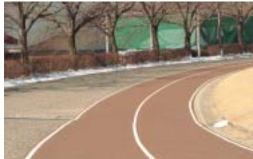
▲LED照明が増設される芝生広場ランニングコース

これを受けて、平成22年度に実施を予定していた小中学校や児童館の修繕、道路や排水路の整備、温泉施設の改修などの公共事業を前倒しするなど、約1億8300万円の補正予算を提出しました。