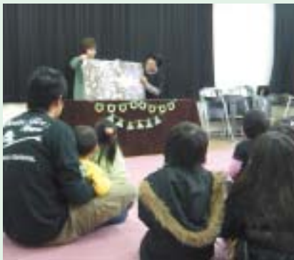
▲大型絵本の読み聞かせの様子

図書館では、毎月第三土曜日に「おはなし子ども会」を開催しています。このおはなし会は「和こども文庫」「おはなしたまご」「おはなしはらっぱ」「くまの子」の4団体に交替で受け持っていただき、影絵・パネルシアター・大型紙芝居等によりお子様はもちろん大人も楽しめる内容となっております。 一度、ボランティアの皆さんのお話しを聞きに来ませんか?