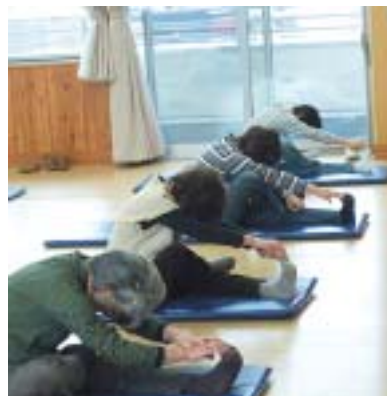
▲ヨガ教室のようす

いき教室」を体験しました。保健補導員OB会が寸劇を披露し、81歳のOB会員が活躍する姿を目の当たりにし驚きと感激をしました。からだの分野では、ヨガ教室を行いました。