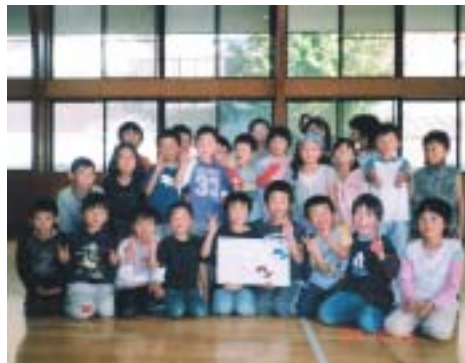
▲運動が終わり仲良く記念撮影

こうした行事が遊びの提案だけでなく、新しい友達づくりのきっかけやより良い関係づくりに繋がっていくよう、さらに工夫を重ねていきたいと考えています。