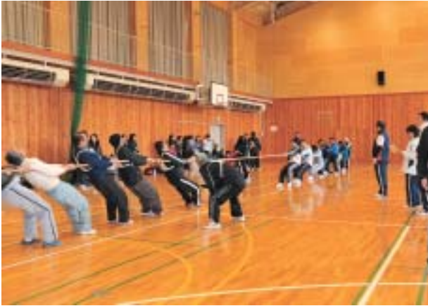
▲綱引き会場のようす