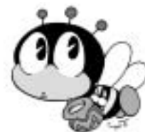
生涯学習キャラクター 「まなびー」

●申し込み・問い合わせ先 東御市教育委員会 事務局 生涯学習課（中央公民館） ☎64-5885 滋野公民館 ☎62-0401 柵津公民館 ☎62-0251 和公民館 ☎62-0201 北御牧公民館 ☎67-3311