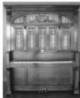
今年で100歳! 元気に奏でますよ

当館ロビーに1910年に製造された「オーケストリオン」という楽器があるのをご存じですか? 大変貴重なもので、「なんでも鑑定団」(スタジオ編)に紹介されることになりました。放映日が決定次第ご案内します。