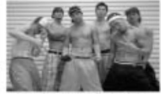
ゲスト 回転タイガース