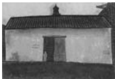
通気塔のある倉庫(木版・守口光)