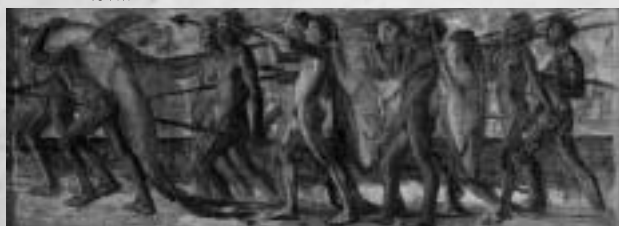
「海の幸」「わだつみのいるこの宮」(重要文化財 石橋美術館蔵)は、原寸大複製画の展示です

■〒389-0406 長野県東御市八重原935-1 ■TEL 0268-61-6161 FAX 0268-61-6162 ■9:30~17:00 ■高校生以上800円 ■月休(但し4/28開館、5/7休館)