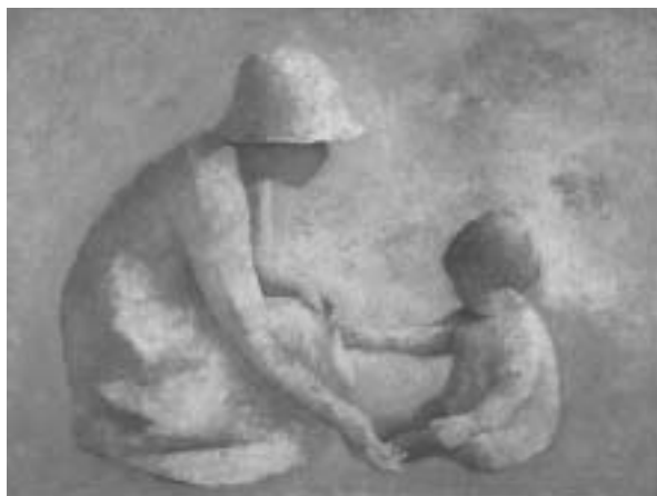
母と子(青山学院蔵)