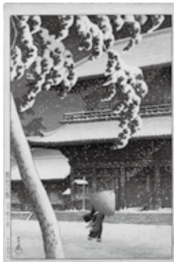
原画提供 丸山 晚霞 記念館